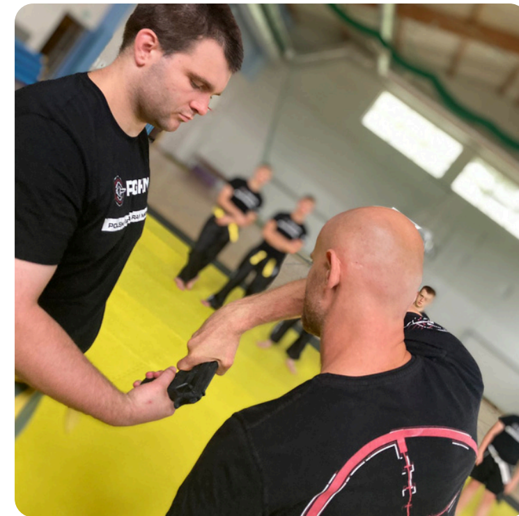
SZKOLENIE WYJAZDOWE MORZE, GÓRY, MAZURY