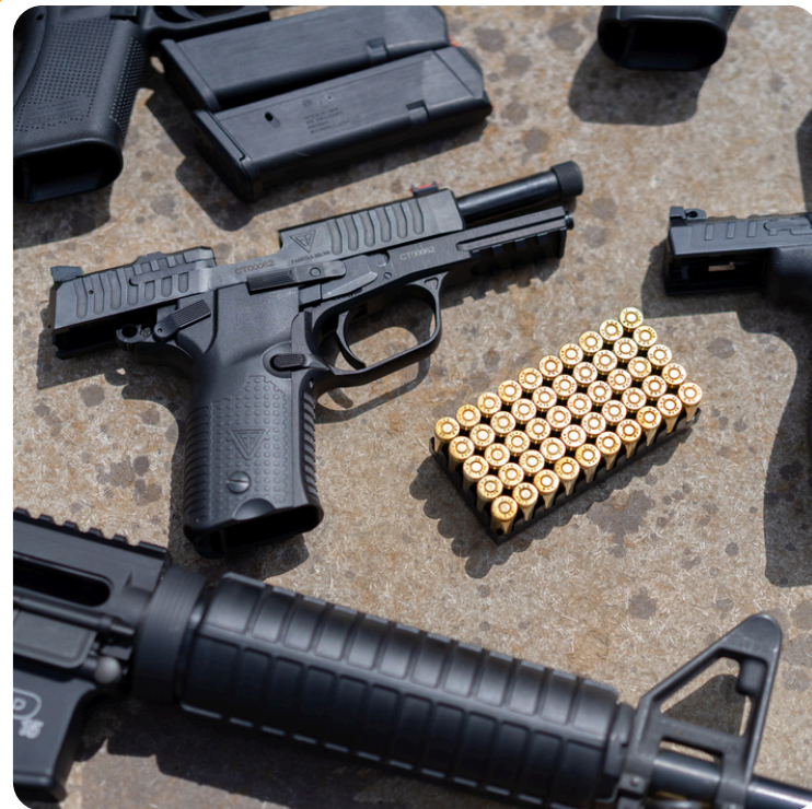
STRZELANIE BOJOWE I SPORTOWE WYJAZDOWO I STACJONARNIE