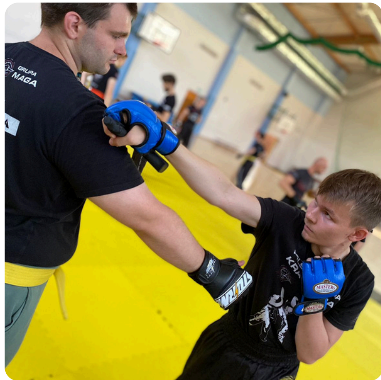
TRENING ZESPOŁOWY W TWOJEJ LOKALIZACJI